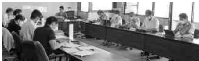
環境生活部水道課の審査