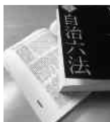
コンプライアンスの実効性ある対策について文書回答を要求

答 『大規模災害への対処等の重要な業務』として、上限時間の特例を適用しています。