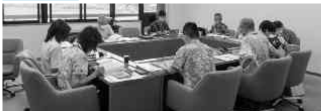
商工観光課の決算審査の様子