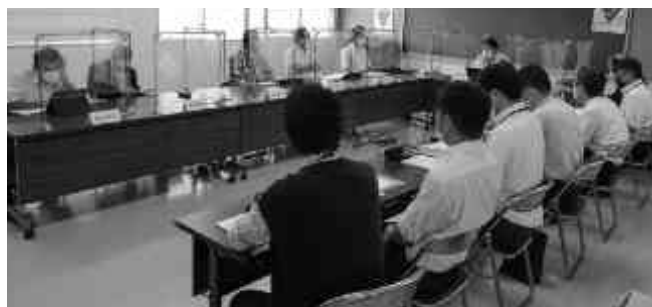
病院事業局の審査