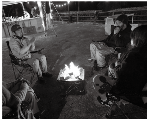
▲夜空のもと、焚き火を囲う様子

テント泊のハードルが高ければコテージ・グランピング・ゲストハウスからチャレンジできますので、観光協会ではお泊り観光の一環として冬の周防大島ならではのお泊りアウトドアを提案していきたいと思えます。