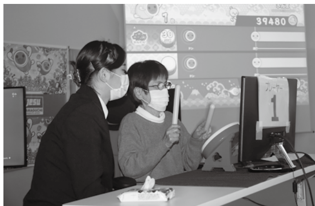
▲大島商船高専コンピュータ部の学生に操作方法を聞きながら、eスポーツを体験する参加者

また、スマホ教室も行われ、町公式LINE「スマホ役場」の操作方法などを学びました。