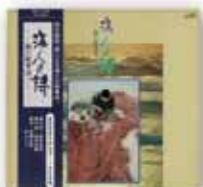
「海人の詩」1974年(昭和49年)