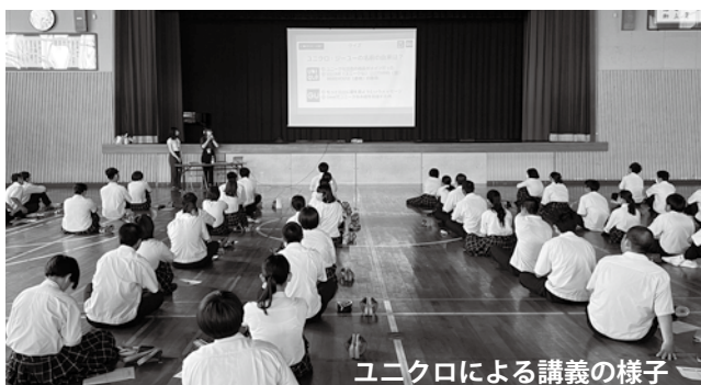
ユニクロによる講義の様子

協力をお願いしていました が、多くの方々のご協力の おかげで、本年度も多くの 服が集まりました。皆さま からお寄せいただいた服と まごころは、ユニクロと国 連の機関を通じて世界の難 民の子ども達に届けさせて いただきます。ご協力、あ りがとうございました。