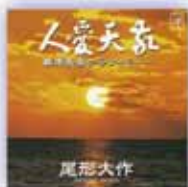
「人愛天歌」1988年(昭和63年)