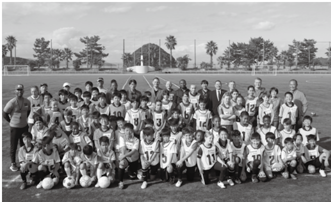
▲交流事業に参加した皆さん