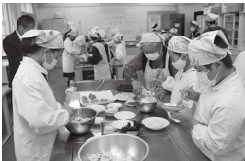
▲料理を作る児童たちの様子

はじめに「食育の5つの力」 についてお話ししました。また、 「朝食をしっかりと食べると勉強 も運動もがんばれるんだよ！」 と、朝食は一日のスタートで あり、その日の活力になるこ とや食べることの大切さを伝 えました。