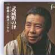
「武蔵野の怪(みち)」1991年(平成3年)