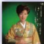
「ほととぎす」1988年(昭和63年)