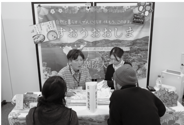
▲12月14日に東京交通会館で行われた移住フェアの様子

れからの展望、生活の利便性についてなど詳しく教えていただきました。制度の話だけではなく、実際に園地で体を動かしてみたことで、移住に対する考えがより深まったと感想をいただきました。 移住を検討している方に対しては、住まいや仕事はもちろん、周防大島の自然の豊かさについても紹介させていただきます。また、この景観を守る活動や地域のさまざまな活動についての情報もお伝えしています。 今後も地域とつなぐ移住相談を続けて参ります。皆さまのご協力をいただき、引き続きよろしくお願いたします。