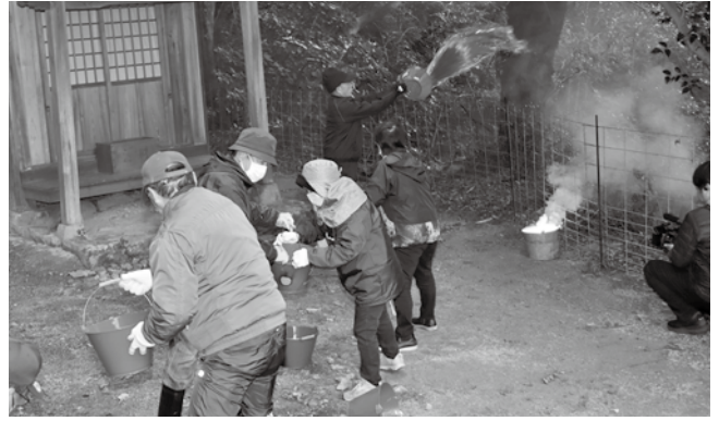
▲バケツリレーによる初期消火訓練の様子