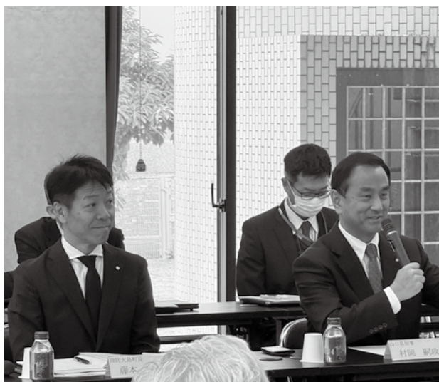
▲東和総合センターで行われた意見交換会の様子