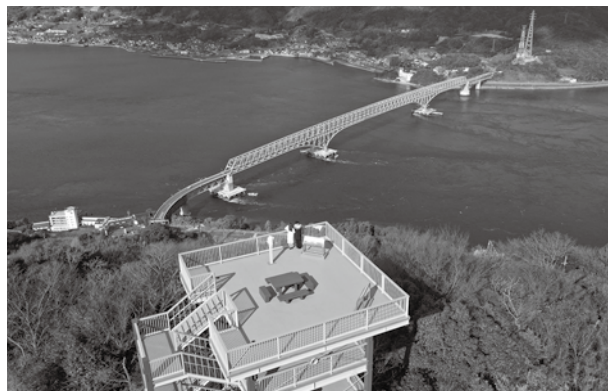
大島大橋を眼下に望む飯の山展望台