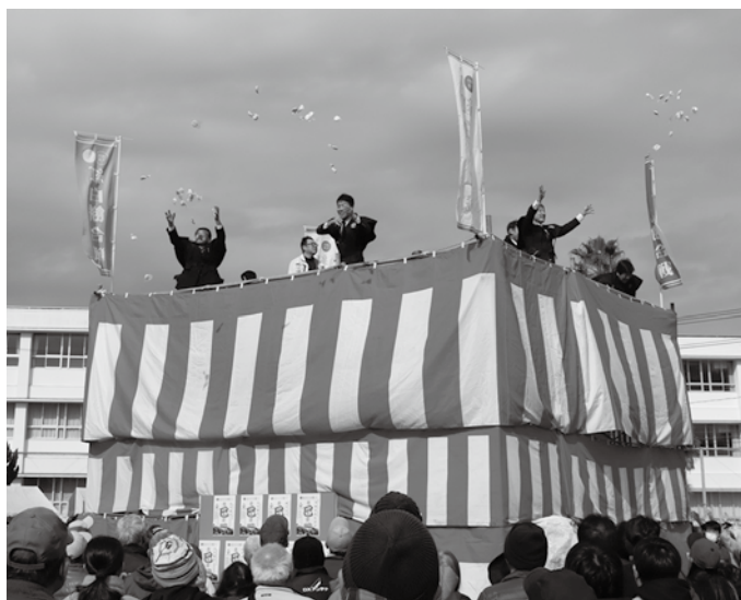
▲4回に分け、2万個の餅が宙を舞った「紅白餅合戦」

日良居グラウンド側では、今年も「紅白餅合戦」と銘打って、総数2万個の餅が宙を舞いました。また、自衛隊、警察、消防の緊急車両乗車体験、ちょび塩（減塩）コーナーなどが設けられ、多くの人で賑わいました。