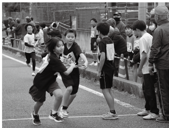
▲タスキをつなぐ選手