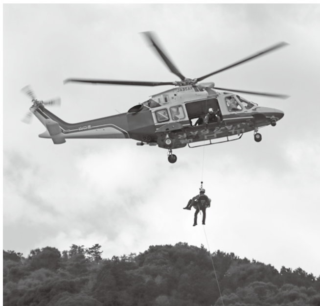
▲防災ヘリコプター「きらら」による救助訓練の様子