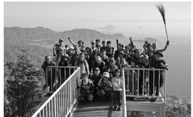
▲前回行った登山道整備時の記念撮影

瀬戸内アルプスならではの自然環境や生態系を保護し、また持続可能な観光資源として登山客との親睦などを目的に、ボランティアを募って登山道や遊歩道などのトレイル整備を行いますので、地元にお住いの皆さんも奮ってご参加ください。（※周防大島観光協会のHPよりご応募ください）