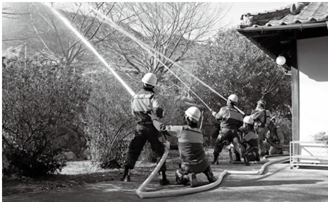
▲日本ハワイ移民資料館前での放水訓練の様子