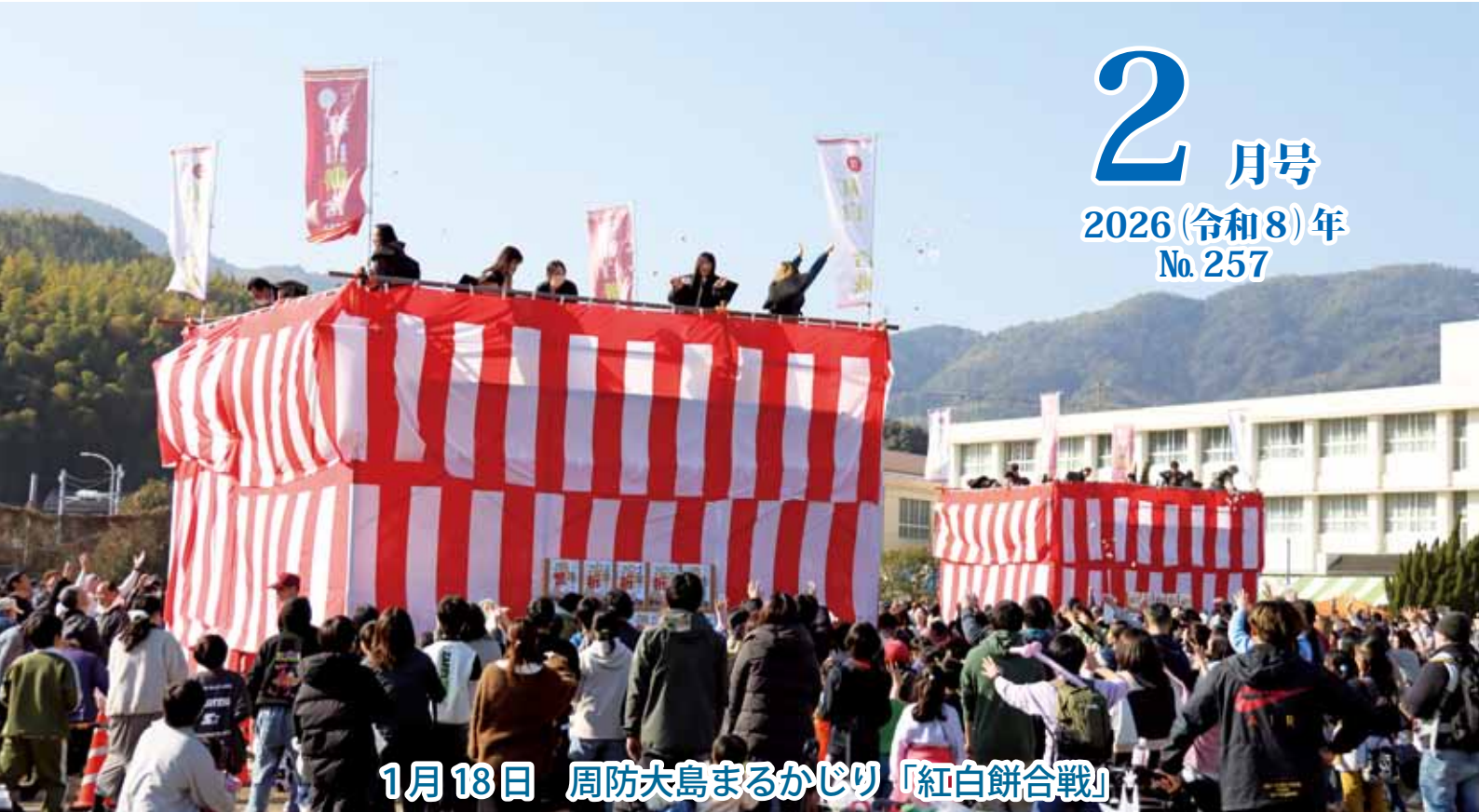
1月18日 周防大島まるかじり「紅白餅合戦」