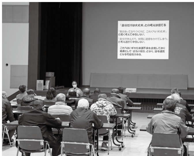
▲安全運転講習会の様子

参加者は本講習を終え、体調管理の必要性や重要性、体調不良時の対処などについて再確認をすることができました。教育委員会では、今後もこのような研修を定期的に行い安全運行の意識向上を図ります。