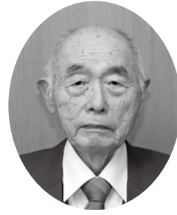
（大島郡周防大島町 連合遺族会会長・ 久賀遺族会会長）