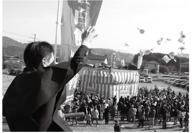
▲紅白餅合戦の様子

当日は天候にも恵まれ、例年を上回る約6千人が来場し、山口大島みかんの販売や地元料飲店による島飯屋台の出店、子どもたちに人気の消防や警察、自衛隊の車両展示など、会場は大いに賑わいました。締めくくりのみかん鍋の振る舞いにも長蛇の列ができ、大盛況のうちに幕を閉じました。