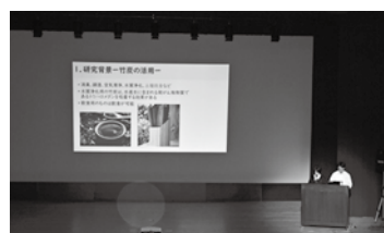
▲発表大会 ▼県立大学出前講座

各学校の代表者により、周防大島の観光地や歴史遺産などの魅力を伝えるために作った映像作品や、地域の老人ホームや保育園等と合同で実施した防災訓練の動画、さらに、データを活用した放置竹林の分布状況や竹炭による土壌改良に関する探究活動の成果などを発表しました。