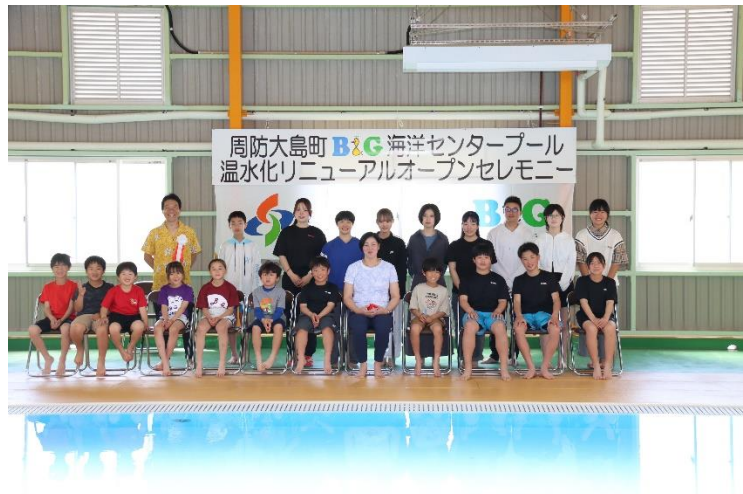
B & G海洋センタープールリニューアルオープンセレモニー