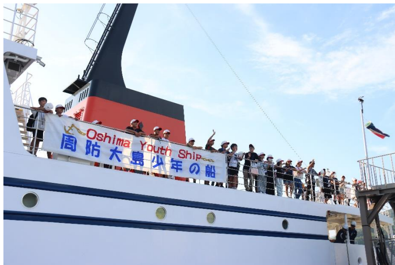
周防大島少年の船