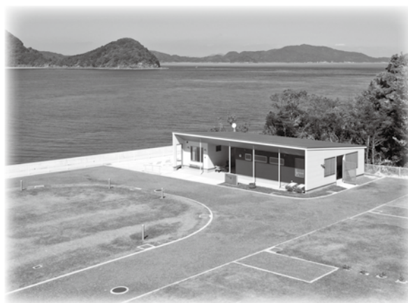
▲沖家室シーサイドキャンプ場