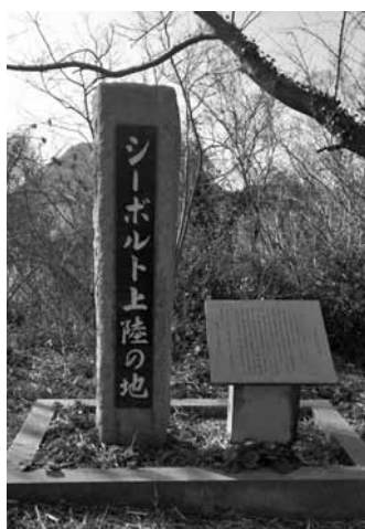
▶シーボルト上陸の記念碑

シーボルトの上陸は、この辺りが古来から海上交通の要衝であったこと、一つの証左であろう。