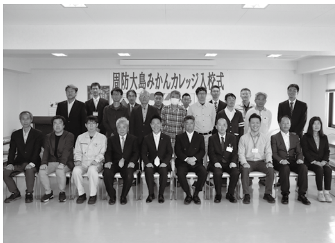
▲2期生の皆さんとの記念撮影の様子

研修期間中は、町、JA、国、県等の支援制度を活用しながら研修受講することが可能で、基礎的知識や技術を学ぶ座学、実際の栽培園地での実習、先進農家への派遣研修等が実施されます。