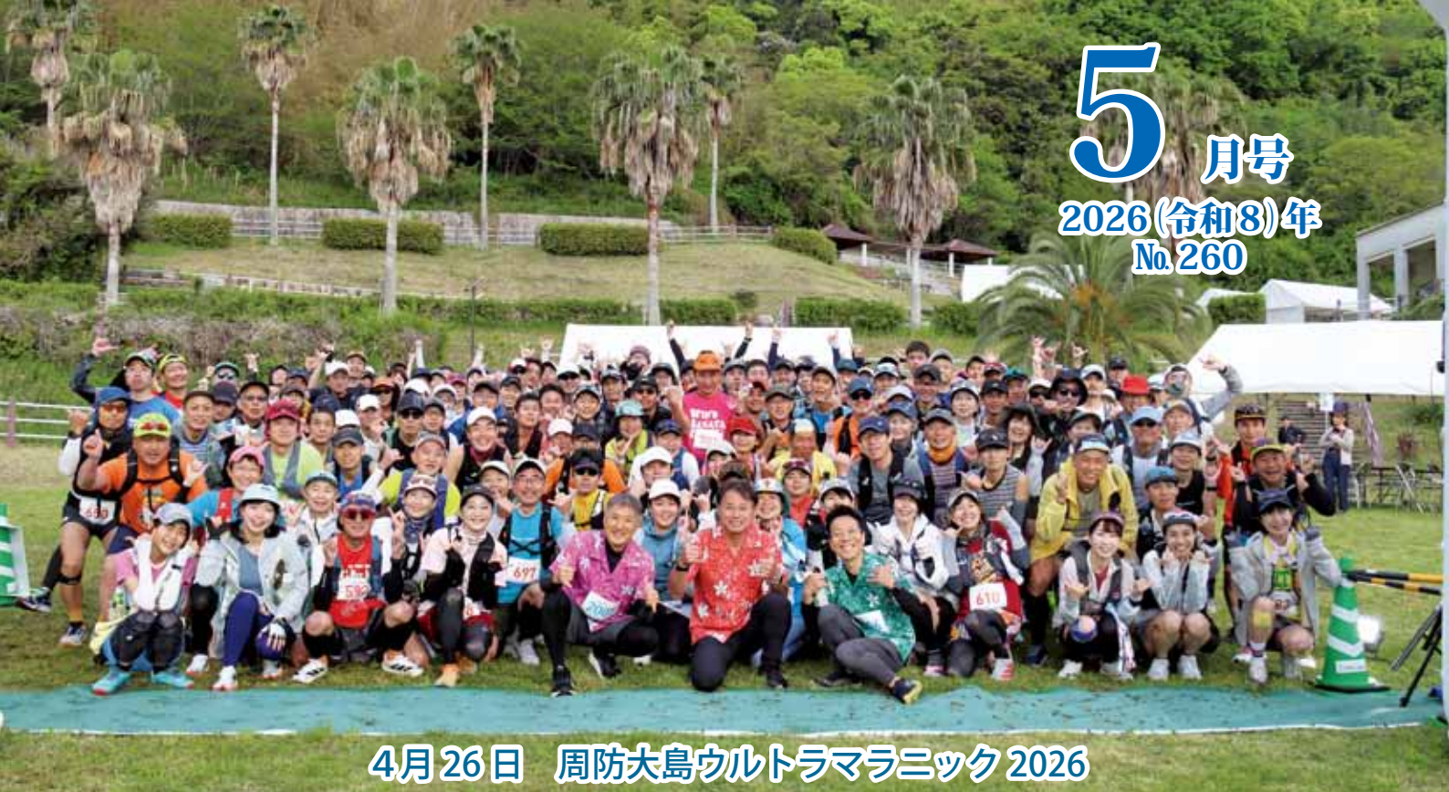
4月26日 周防大島ウルトラマラニック 2026