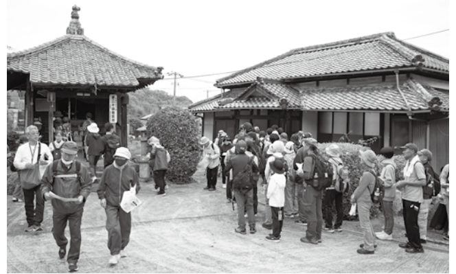
▲札所をめぐる参加者の皆さん

当日は、曇り空が広がる天気となりましたが、参加者の皆さんは、地図を片手に思い思いのルートで楽しまれ、歩き終わった後には、365歩賞のガラポンや、豪華賞品の当たる大抽選会も行われ、会場は大いに盛り上がりました。