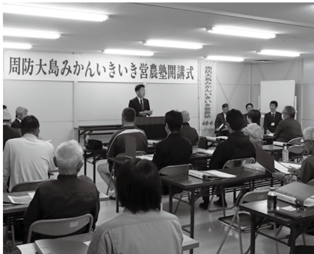
▲柑きつ振興センターでの開講式の様子