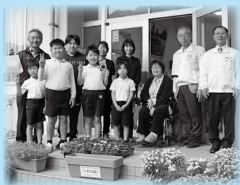
▲「人権の花」贈呈式の様子 (浮島小学校)