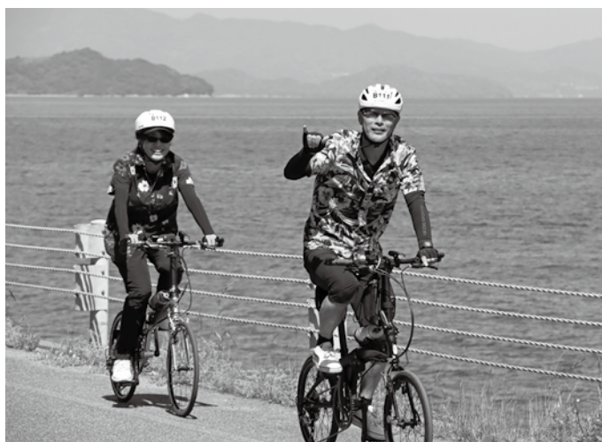
▲今年は新企画としてハワイアンコーデでの参加も呼びかけ、アロハシャツを着た参加者も多く見られました

参加者は、瀬戸内海の多島美や人気のフォトスポットでの撮影など絶景を楽しみながら、またエイドステーションでは周防大島ならではの地元料理やアロハメニューなど周防大島の魅力を満喫しました。