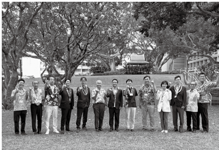
▲母親が山口県出身であるデービット・イゲ前ハワイ州知事（左から6番目）との写真撮影を行う藤本町長（一番左）たち

本サミットは、ハワイ州との間で姉妹州・姉妹都市関係にある日本の自治体が一堂に会し、文化・教育・経済・相互親善などについて意見交換等を行うものであり、山口県・山口市と共同で設置した展示ブースにて周防大島町のPRを行いました。