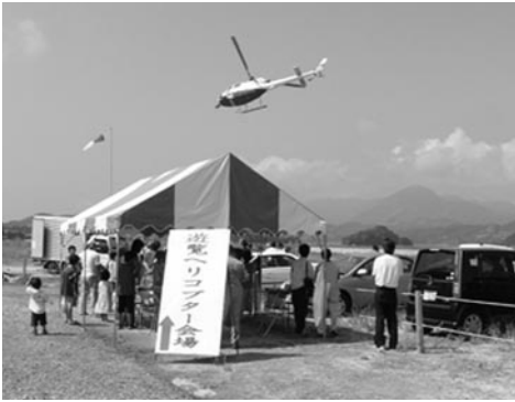
東和町閉町式典・ファイナルフェスタ（9月19日）

合併を控えた大島郡の4つの町では、9月に閉町行事やファイナルフェスタが開かれました。