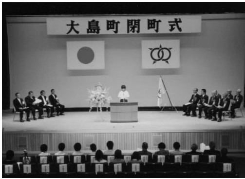
大島町閉町式典（9月21日）