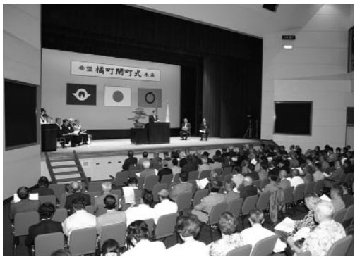
橋町閉町式典（9月23日）