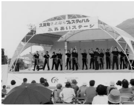
久賀町閉町式典・さよならフェスティバル（9月20日）