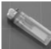
プラスチック製ライター