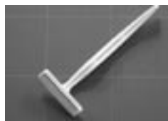
カミソリ（柄がプラスチック製のもの）