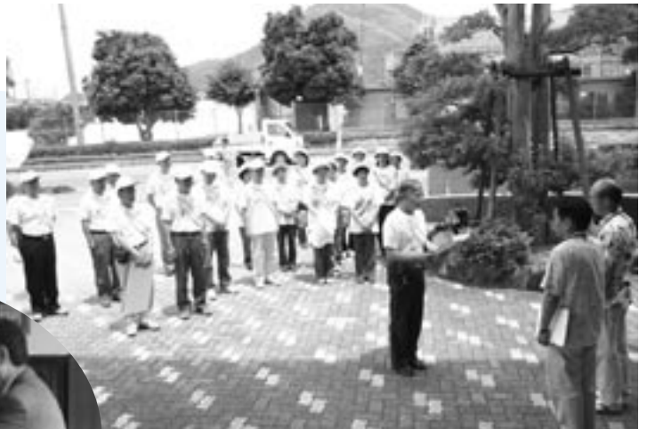
久賀庁舎でメッセージの伝達