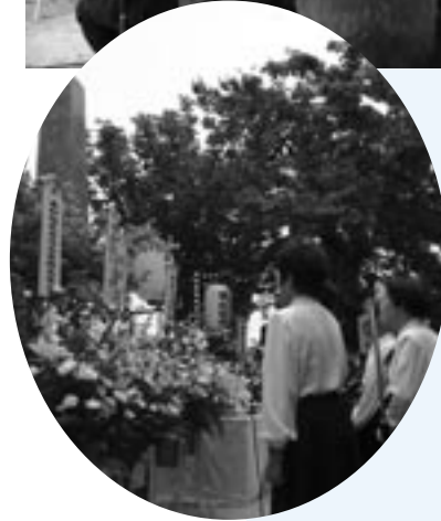
吟詠友の会 油田有志の 皆さんによる奉納吟詠

6月8日、戦艦陸奥殉難将兵慰霊祭が伊保田で行われました。昭和18年のこの日、戦艦陸奥とともに伊保田の沖合いに沈んだ1121名の将兵の冥福を祈り、平和を願うため毎年多くの遺族や関係者が参列しています。