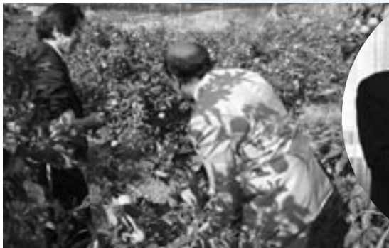
「南津海」の色づくみかん園を視察。