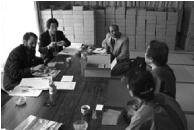
橘みのり工房で手作り缶詰の話聞く。