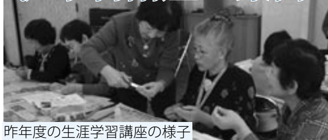
昨年度の生涯学習講座の様子