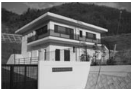
沖浦東地区浄化センター（出井）

家房、出井および津海木地区では、平成16年度から下水道管等の整備に着手し、皆さんに大変ご迷惑をおかけいたしました。この度、全ての工事が完成し、3月31日から下水道の供用を開始します。