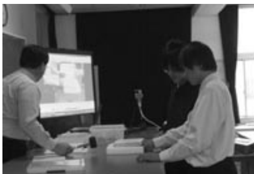
▼理科総合Aの授業風景

感想…高校の授業進度に戸惑いを覚えていましたが、中学の内容と関連づけることで興味・関心を持ってました。