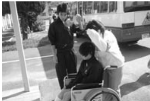
▼福祉体験実習の様子

感想…車椅子を押してみても難しかったです。高校生が優しいのでやりやすかったです。今回の体験で福祉に興味を持つことができました。