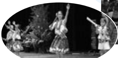
文化祭でのアロハ大島アラハーツの皆さん