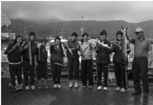
笑顔も魚もいっぱいです。