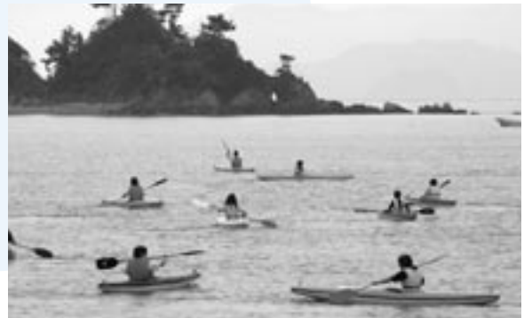
島を目指して一生懸命こぎました。

都会ではできない周防大島ならではの体験に、生徒達からは「また周防大島にきたい。」「農業や漁業の大変さが分かった。」などの感想が聞かれました。