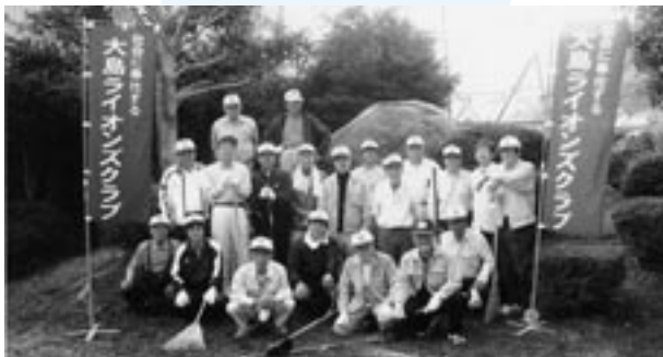
大島ライオンズクラブの皆さん

また、椋野地区老人クラブの皆さんが9月18日早朝から、椋野公民館周辺を清掃しました。同老人クラブでは年2回、庭木の害虫駆除や剪定、除草作業などを行っている、「気持ちよく公民館を利用できる」と喜ばれています。