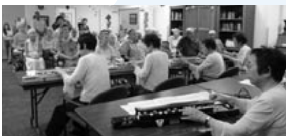
プアケアホームでの大正琴の皆さん