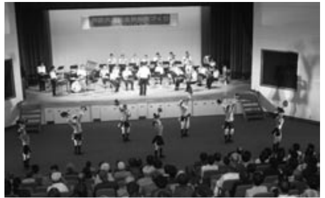
県警察音楽隊による演奏

10月14日、橘総合センターで全国地域安全運動の一環として『安全フェスタ in 大島』が開催されました。