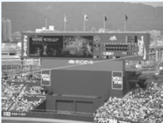
▲6月27日に開催した第1回目の観光PRの様子(対中日戦)