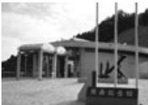
No 4: 周防大島町陸奥野営場等