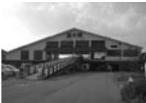
No 5: 周防大島町総合交流ターミナル