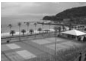
No 3: 周防大島町サン・スポーツランド片添等

【指定管理者制度とは】 従来の管理委託制度とは異なり、施設の管理に民間の能力やノウハウを幅広く活用しつつ、住民サービスの向上、コストの節減等を図ることを目的とするものです。