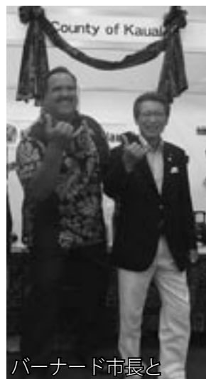
バーナード市長と

このイベントは、ハワイ州観光局やハワイ4島のフラ団体が参加して、今年から拡大開催されたものです。ハワイ4島からは、唯一大島と姉妹島カウアイ市からバーナード新市長や経済開発局の観光担当、またカウアイ島のクムフラが参