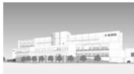
▲大島病院移転後のイメージ図