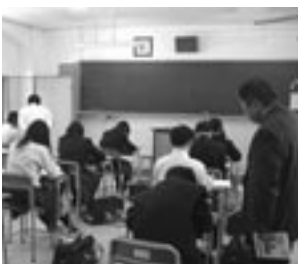
▲中高教員によるきめ細かい指導

中学校の交流授業では、中高教員のチームティーチングにより生徒一人ひとりにきめ細かい指導を行います。また、高校では、数・英について中学校教員も加わり授業を展開しています。