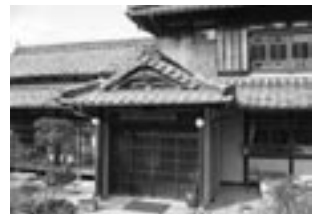
No 2: 日本ハワイ移民資料館