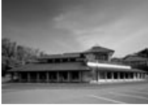
No 6: 竜崎温泉潮風の湯