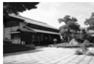
No 1: 周防大島町久賀歴史民俗資料館等