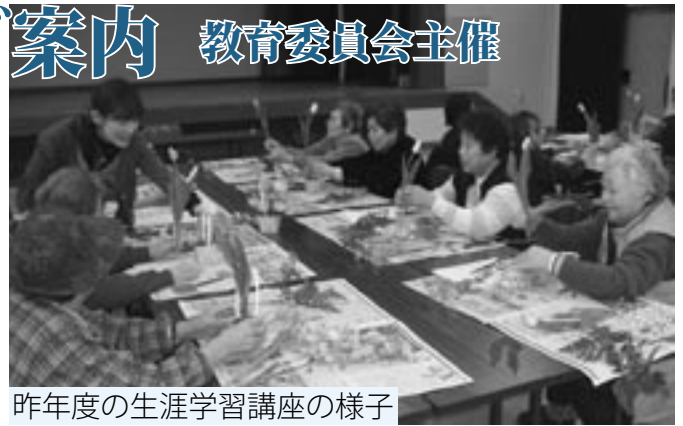
昨年度の生涯学習講座の様子