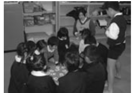
▲放課後児童クラブの様子 (久賀児童館)

◆問い合わせ 福祉課 ☎0820(77)5505 社会教育課 ☎0820(78)2205