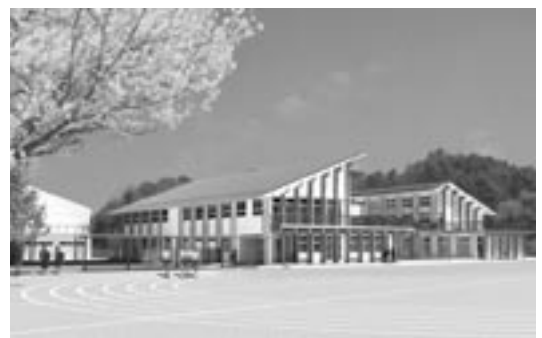
▲東和中学校改築後のイメージ図