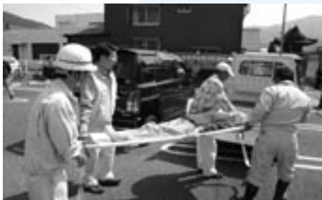
被災者救出の様子