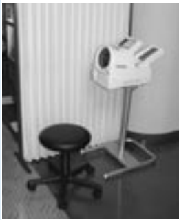
▲設置された自動血圧計

久賀総合センター、東和総合センターに自動血圧計を設置しました。(写真)日頃から血圧を測定し、健康管理に役立てていただきたいと思えます。大島地区にはしまとぴあスカイセンターに、橘地区にはたちばなケアプラザに設置していますので、ご利用ください。