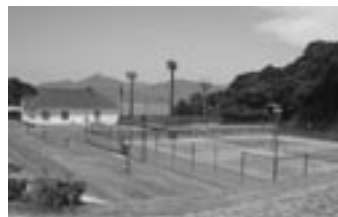
周防大島町長浦スポーツ海浜スクエア