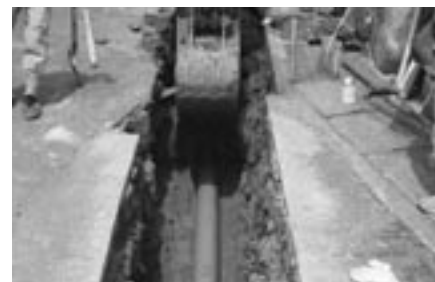
▲下水道工事の状況

今月号は、③自然と環境にやさしい町④晩年を豊かで安心して過ごせる町の主要事業について紹介していきます。