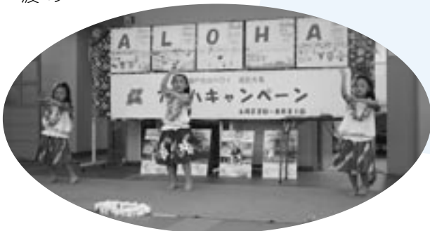
▲フラダンスを披露するアロハ大島フラハーツの子どもたち。