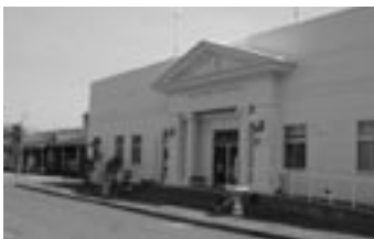
周防大島町グリーンステイながうら

従来の管理委託制度とは異なり、施設の管理に民間の能力やノウハウを幅広く活用しつつ、住民サービスの向上、コストの節減等を図ることを目的とするものです。