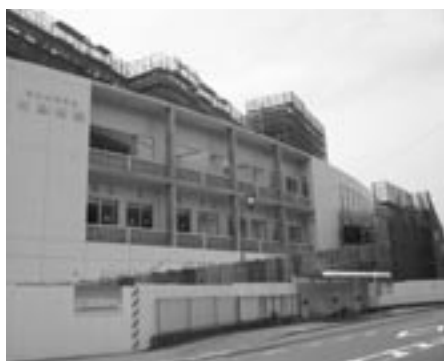
▲建設中の大島病院