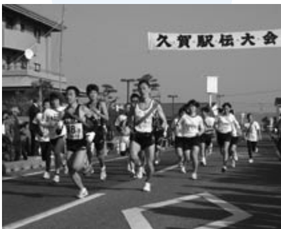
一般男子・一般女子のスタートの様子

2月21日、久賀の街をタスキでつなぐ久賀駅伝大会が開催されました。 一般の部は農業者健康管理センターから八幡生涯学習のむらまで、スポ少女子・小学生低学年の部、スポ少男子の部とともに防災センター周辺の5区間を走りました。 当日は気温も高く、選手は汗をいっぱいかきながら、タスキをつなぎました。