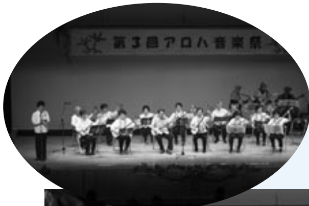
大島三味線教室による演奏