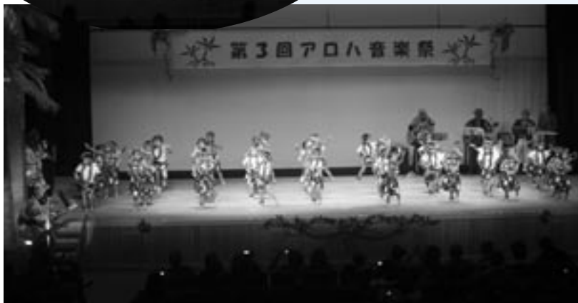
町内6保育園児によるフラダンス 「ブラチーム大島っ子」のフラ