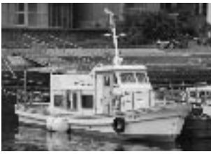
▲第7せと丸 (情島航路)