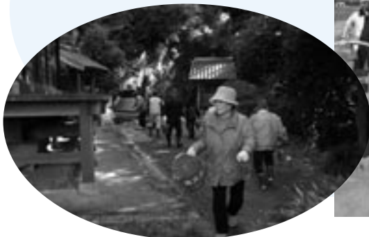
▲東三蒲での初期消火訓練の様子

伊保田では防火水槽などからホースを中継して放水訓練などを行い、また東三蒲ではバケツリレーでの初期消火訓練などを行い、文化財を火災から守る防災意識を高めました。