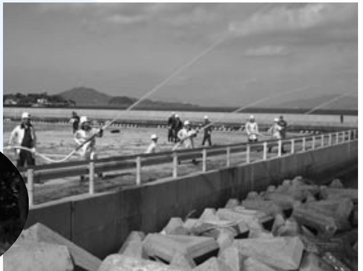
▲伊保田での放水訓練の様子

1月24日、伊保田の深広寺・浄専寺周辺で、また26日には、東三蒲の松尾寺で消防訓練が行われました。これは文化財を火災などの災害から守ろうと、26日の文化財防火デーに併せて行われたものです。