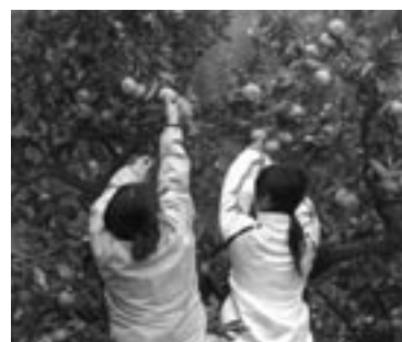
▲お互いに協力しながら収穫