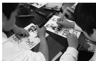
▲キーホルダー作りの様子

周防大島町放課後子ども教室のなぎさクラブ、わだっ子クラブ、たちばなっこクラブの3団体の子どもたちが、選手一人ひとりへ手造りのプラ板キーホルダーを作製しプレゼントする活動です。