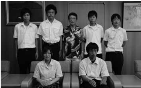
▲インターハイへ出場したみなさん（授与式：7月25日）