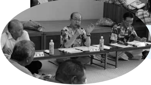
意見を述べる二井県知事（写真中央）、写真右が椎木町長、左が柳居県議会議員