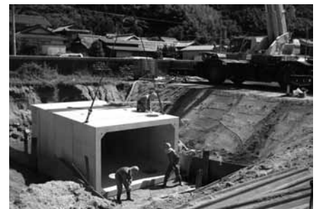
▲防火水槽設置工事の様子