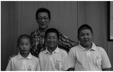
▲高野山旗学童軟式野球選手権大会へ出場したみなさん（授与式：7月11日）