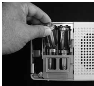
単2の電池（アルカリ電池推奨）が4本必要です。