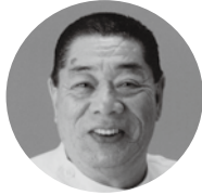
たかみね ケーシー高峰