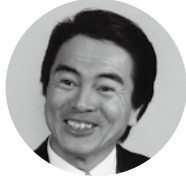
えどやねこはち 江戸家猫八