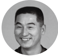
きんげんていばしょう 金原亭馬生