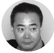
ごかいどうくもすけ 五街道雲助

周防大島町とNHK山口放送局では、周防大島町合併7周年などを記念し、ラジオ第1放送「真打ち競演」の公開録音を実施します。