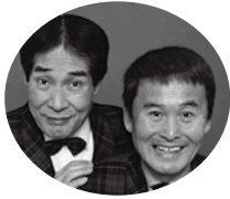
あずまきょうまるきょうへい 東京丸・京平