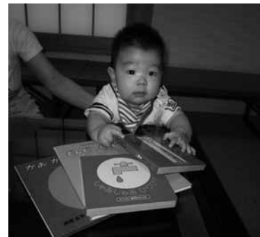
▲読み聞かせサポート事業