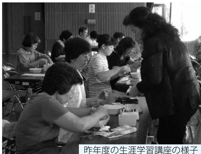
昨年度の生涯学習講座の様子

大島公民館 ☎ 74 - 3800 F A X 74 - 3999 oshimakoyoi@town.suo-oshima.lg.jp