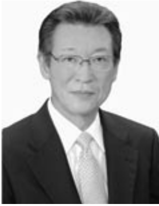
周防大島町長 権木 巧