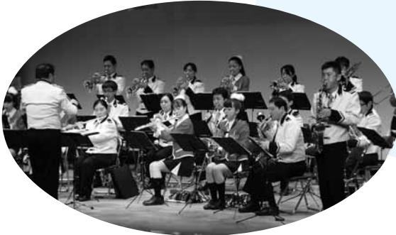
▲ 県警音楽隊によるコンサート

10月17日、大島文化センターで全国地域安全運動の一環として『安全フェスタ in 大島』が開催されました。イベントでは振り込め詐欺被害防止の寸劇、県警察音楽隊によるコンサートが行われ、振り込め詐欺被害防止の寸劇では「オレ、オレだよ母ちゃん。風邪をひいて声がおかしいんよ。実は会社の金を使っちゃって、示談金として300万円支払わんといけんように