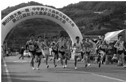
▲昨年の大会の様子