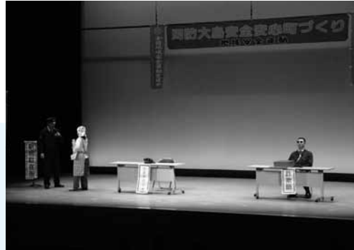
▶ 柳井警察署劇団「ザ・ポリスターズ」による振り込め詐欺被害防止の寸劇

なつたんよ。今日中に返さんといけんけえ、振り込んでほしい。」と言葉巧みに話を持ち掛ける「オレオレ詐欺」について説明がありました。 「あやしいと思ったら一人で悩まず、警察などに相談してほしい。」と注意を呼びかけました。