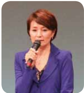
女優 仁科亜季子さん

大会では仁科亜季子さんによる講演会も開催されました。仁科さんは子宮頸がんを経験され、予防ワクチン・検診の大切さを話されました。