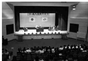
▲昨年の成人式の様子