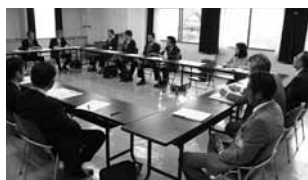
▲5月8日 久賀での意見交換会の様子

町民の皆さんが積極的に町政運営に参画する仕組みとして、平成22度から町長自らが町民の皆さんのところに出向き、自由な雰囲気の中でひざを交えて話し合いを行い、町民の「声」を聴く意見交換会「町長と意見交換会（ワンテーマディスカッション）」を実施しています。4月から9月までに開催された意見交換会は表のとおりです。