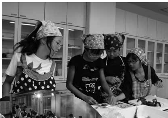
料理では子どもたちが魚をさばきました。