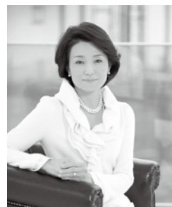
講演会 講師 女優 仁科亜季子氏