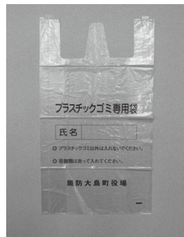
▲プラスチックゴミ専用袋(大)見本