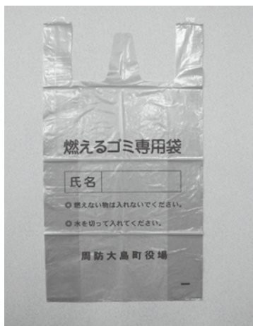
▲燃えるゴミ専用袋(大)見本