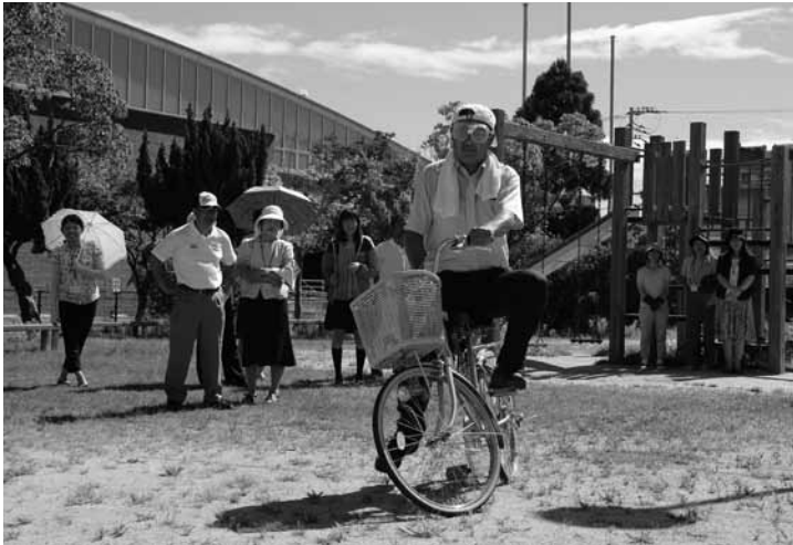
▲フラフラになりながら自転車を運転しました。

参加者はフラフラになりながら自転車を運転する恐怖を知り、飲酒運転はぜったいにしてはいけないと、気を引き締めました。