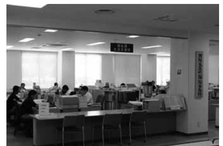
▲福祉事務所窓口 (たちばなケアプラザ内)