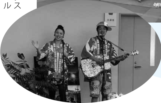
▲「海の花束〜アワサングありがとう」を歌うマウンテンマウス