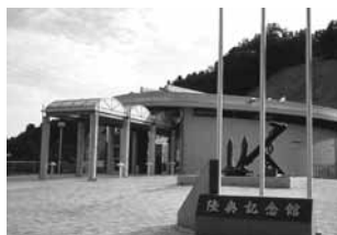
No 3：周防大島町陸奥野営場等

従来の管理委託制度とは異なり、施設の管理に民間の能力やノウハウを幅広く活用しつつ、住民サービスの向上、コストの節減等を図ることを目的とするものです。