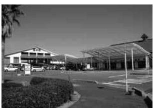
No 4：周防大島町総合交流ターミナル