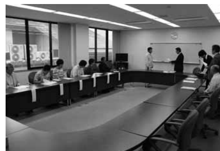
▲5月25日 地域づくり活動支援事業交付式