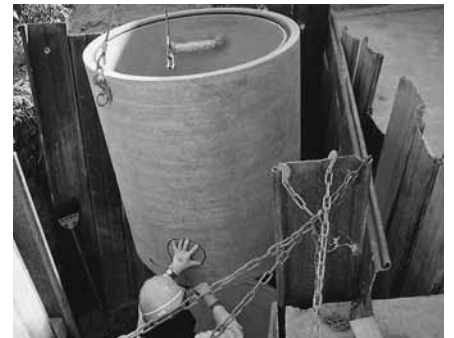
▲下水道工事の様子