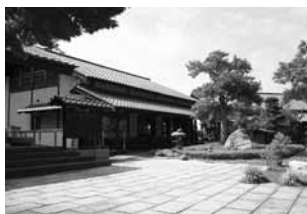
No 1：周防大島町久賀歴史民俗資料館等