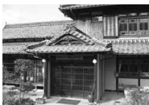
No 2：日本ハワイ移民資料館