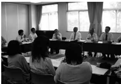
▲健康増進計画推進委員会の様子

今年度は、多くの方に健康に関心を持っていただけるよう、地域での出前講座や、ちよび塩(少しの塩分)料理のレシピの配布、摂取した塩分の傾向を知るために尿の検査(ウロペーパーを使った簡易な検査)を実施します。団体や地域のみなさんの集まる機会に、出向きますので、気軽に声をかけてください。