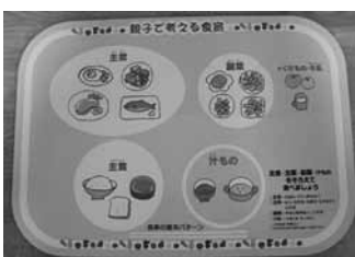
ランチョンマット