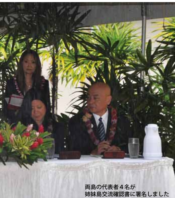
両島の代表者4名が姉妹島交流確認書に署名しました