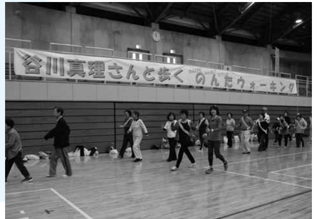
▲ウォーキングの様子。当日は雨天のため町総合体育館で開催されました。