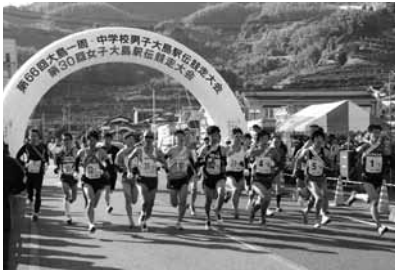
▲昨年の大会の様子