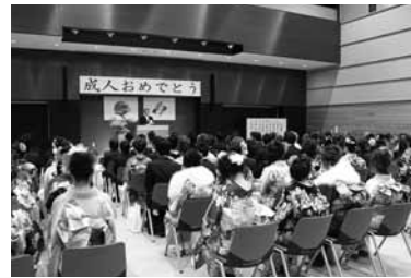
▲昨年の成人式の様子