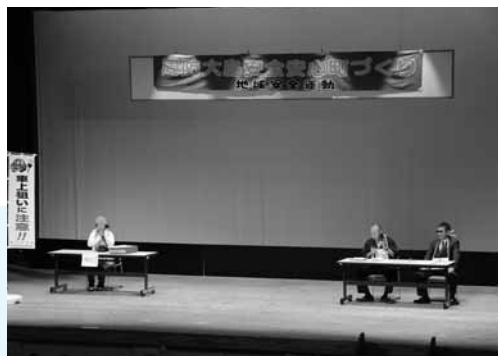
▶ 柳井警察署劇団「ザ・ポリスターズ」による振り込め詐欺被害防止の寸劇

イベントでは振り込め詐欺被害防止の寸劇、県警察音楽隊によるコンサートが行われ、振り込め詐欺被害防止の寸劇では「社会保険庁の者ですが、医療費が3万円もどつてくるので、銀行のキャッシュカードを持って銀行に行ってもらえますか。銀行に行ったらATMの操作を指示