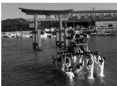
▲10月13日 土居神社の秋祭りの様子

毎月恒例「島くらす海そうじ」11月の海岸清掃は、30日(土)午後2時から下田、嶋津鮮魚店前の海岸で行います。よろしくお願ひします。