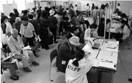
▲健康相談・体験コーナーの様子