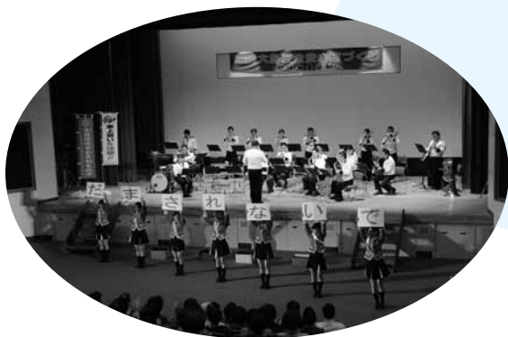
▲ 県警音楽隊によるコンサート

「あやしいと思ったら一人で悩まず、ご家族や地域の皆さん、警察などに相談してほしい。」と注意を呼びかけました。