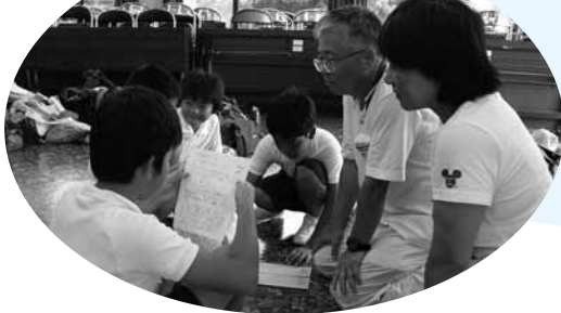
▲8月2日の離村式で手紙を読む児童