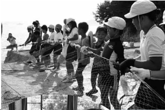
▶ 7月31日に行われた地引網の様子

体験学習に参加した児童は、3日間の宿泊体験を通じて、改めて周防大島の自然の良さを知ることができました。