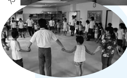
▲親睦ゲームの様子