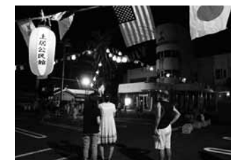
▲8月14日 土居で開催された盆踊りの様子

周防大島全体が沈むくらいの人が多さにびっくりしました。「盆に帰る」ということがこれほどまでに習慣になっっている町には住んだことも行ったこともなかったです。人の多さもさることながら、それぞれの地区で催される盆踊りもすごい。8月14日は土居の盆踊りで太鼓をたたかせていただきました。この地域に古くから伝わる音頭、口説きに関わって感激。公民館に集っての練習も楽しかったです。15日、沖家室の盆踊りで見えた大阪踊りはハイカラな感じ。「昔は三日三晩休まず踊ったのに、どんどん短くなっちゃって…」とか帰省した方の話を聞かせてもらいました。16日は安下庄。奈良時代から伝わる音頭と口説きをはじめ5種類の太鼓がありました。最後の「ヘイヘイ」は呆気にとられました。かなり最高です。