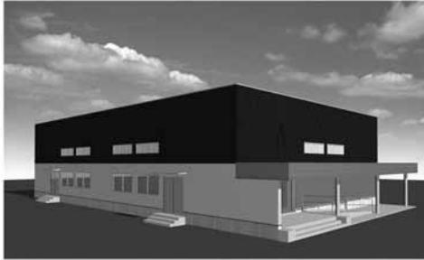
▲明新小学校屋内運動場建設後のイメージ図