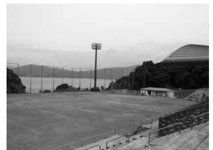
▲長浦スポーツ海浜スクエア総合グラウンド