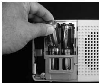
単2の電池（アルカリ電池推奨）が4本必要です。