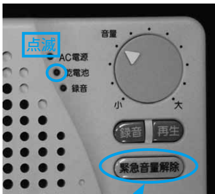
押すと一時的に音が止まる