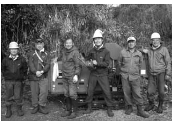
▲2月14日には、周防大島を美しくするため、『美しい三浦を創る会』の方といっしょに、人生初の竹きりに挑戦しました。

する時に、武器になるとも思いました。周防大島には都会にあるものがなかったりすることがありますが、逆に都会にないものが沢山あるこの島はとても魅力的です。そして、さらに魅力ある美しい周防大島にするために、漂着ゴミ回収の活動をスタートします。第1回目は周防大島Uターンを応援する会「島くらす」主催で、3月20日(水)・祝日、午前8時30分より1時間程度、ビー玉海岸で行います。この島を美しく、もっと魅力的にできたらと思ひ企画しました。町民皆様のご協力をよろしくお願ひします。