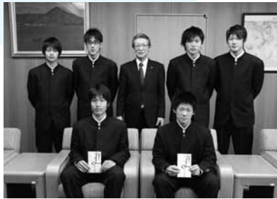
▶ 全国大会へ出場するみなさん（授与式…2月8日）