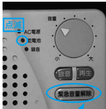
押すと一時的に音が止まる

緊急解除ボタンを押すと、一時的に警告音を止めることができます。放送を受信すると再び警告音が鳴ります。