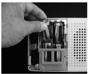
単2の電池（アルカリ電池推奨）が4本必要です。

電池の交換が終わりましたら元に戻し、アンテナやコンセントなどを確認してスイッチを入れます。赤色のランプが消えて緑色のランプが点灯していれば電池交換の終了です。