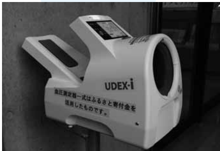
▶ 設置された血圧計

このたび、ふるさと寄附金を財源にたちばなケアプラザ、しまとぴあスカイセンター、大島文化センターに全自動血圧計一式（全自動血圧計、専用架台、椅子）を設置しました。 血圧の管理は生活習慣病の予防につながる出発点です。お越しの際には、気軽に血圧をチェックし、体調管理の目安としてご利用ください。