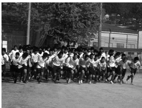
▲ふれあいマラソンの様子

高校のグラウンドを出発し、ゴールの安下庄中学校を目指して、約310名の中高生が町を駆け抜けました。一生懸命に走る生徒の姿に、地域の方々から温かいご声援をいただきました。ありがとうございました。