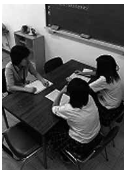
▲カウンセリングの様子

久しぶりに中学校の先生にお会いして、高校生活での体験や出来事を話した。楽しいことや、変わったこと、不安になっていたことなどを聞いていただいた。これからの高校生活も、充実した生活を送っていききたい。