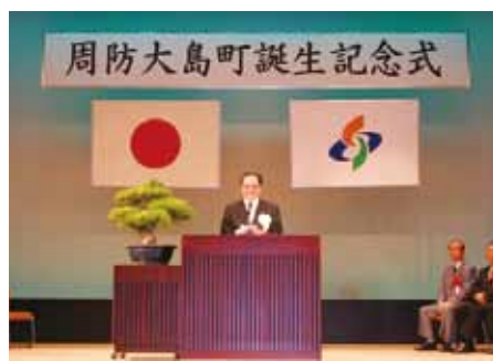
▲周防大島町誕生記念式 〈平成17年6月11日〉 式では町章・町花（みかんの花）・町木（みかんの木）の発表がありました。