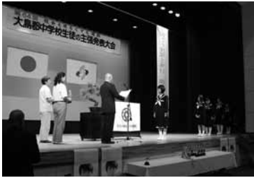
▶10月7日 大島郡中学校生徒の主張発表大会表彰の様子