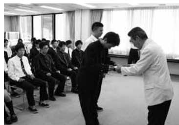
▲10月3日に行われた激励費授与式の様子