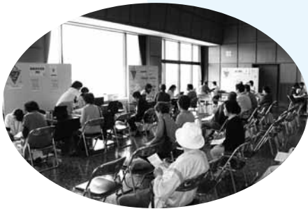
▶健康相談・体験コーナーの様子（東和総合センター）