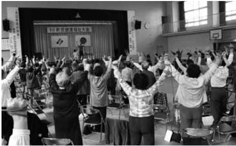
▲ゴムチューブを使った介護予防運動の様子（森野小学校体育館）