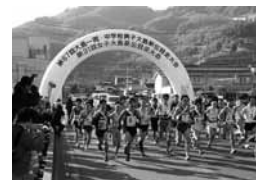
▲昨年の大会の様子