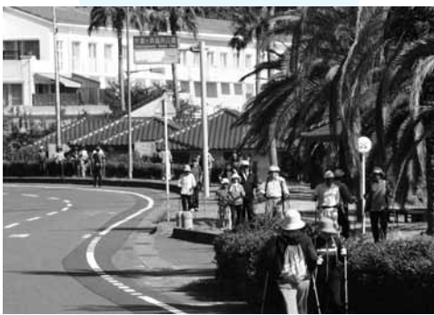
▲ノルディックウォークで汗を流す参加者（5キロコース）

10月18日、町陸上競技場において健康づくりや介護予防で注目されているノルディックウォークを体験する、「のんたウォーキング2014」が開催されました。