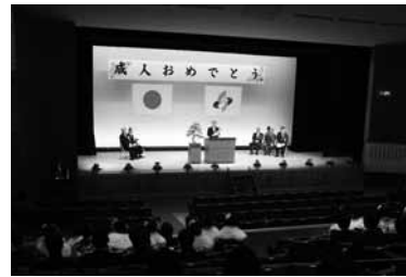
▲昨年の成人式の様子