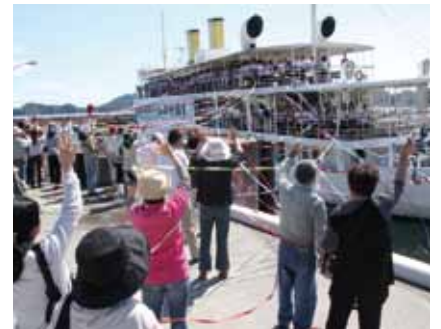
▲体験型教育旅行受入開始 〈平成20年11月4日〉 これまで87校約13,300人の生徒らが、周防大島町を訪れました。