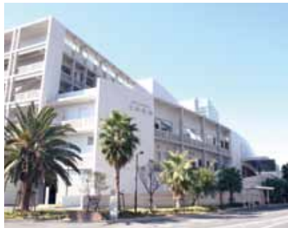
▲大島病院開院 〈平成22年11月1日〉 療養病床が60床がとなり、長期療養に配慮した病院になりました。