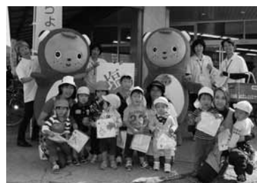
▲10月8日 第1回ちょび塩の日PR活動の様子