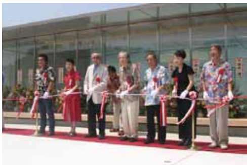
▲星野哲郎記念館オープン 〈平成19年7月26日〉 式典には歌手・作詞家・作曲家など多くの方が出席し、開館を祝いました。