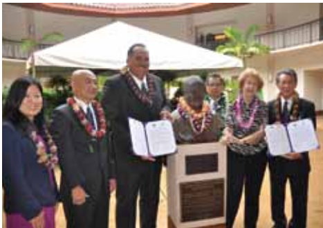
▲周防大島町・カウアイ島姉妹島提携50周年記念式典（カウアイ島にて） 〈平成25年10月11日〉 両島の代表者4名が、姉妹島交流確認書に署名しました。

3月12日 久賀中学校新校舎竣工式 3月31日 和田小学校閉校 4月14日 東和病院東棟改築工事完工式 10月1日 周防大島町誕生10周年