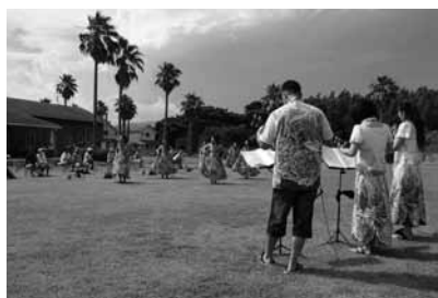
▲今年のサタフラの様子

さて、毎月恒例の海岸清掃、今回は、10月4日(土)午前10時より三浦の西の浜を清掃します。周防大島UIターンを応援する会・島くらすと美しい三浦を創る会による共同開催です。台風11号の影響による多くの漂着ゴミをみんなの力で片付けられたらと思います。ご協力のほどよろしくお願い致します。