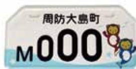
▲ナンバープレート(見本)