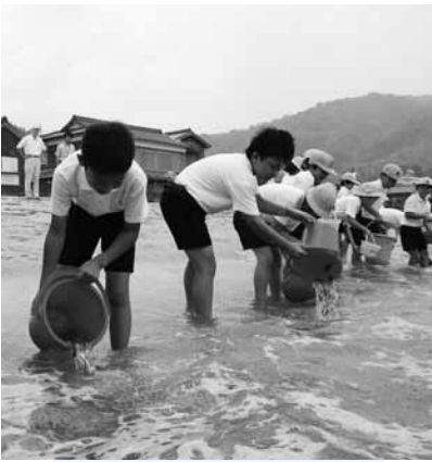
▲マダイの稚魚を放流する児童

7月16日、三浦小学校全校児童19名が西三浦の浜辺において、マダイの稚魚を放流しました。児童は大島町漁協から手渡された、約500匹を「大きくなってね。」と願いを込めながら放流しました。 今回放流したマダイの稚魚は約6センチで2、3年で約30センチ以上に育ちます。