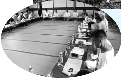
佐連会館で行われた意見交換の様子

また、海岸清掃の後には地域住民の方々との意見交換会も行われ、今後のニホンアワサングの保全や活用について、活発な意見が出されました。