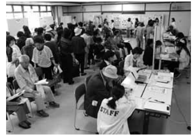
▲昨年開催された町民健康福祉大会の様子。今年は10月26日に開催します。