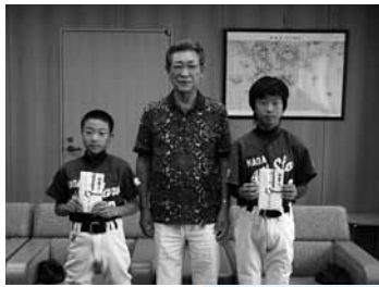
▲全日本小学生男子ソフトボール大会へ出場したみなさん（授与式：7月15日）

7月16日、三浦小学校全校児童19名が西三浦の浜辺において、マダイの稚魚を放流しました。児童は大島町漁協から手渡された、約500匹を「大きくなってね。」と願いを込めながら放流しました。 今回放流したマダイの稚魚は約6センチで2、3年で約30センチ以上に育ちます。