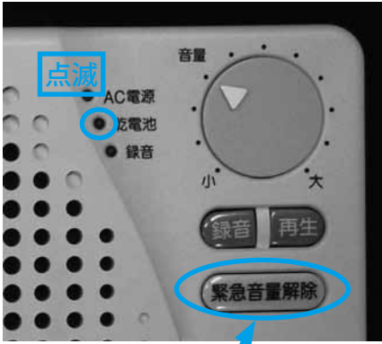
押すと一時的に音が止まる

緊急解除ボタンを押すと、一時的に警告音を止めることができます。放送を受信すると再び警告音が鳴ります。