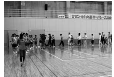
▲昨年開催されたのんたウォーキングの様子。今年は10月18日に開催します。