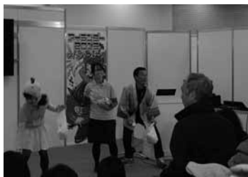
▲ 11月23日・24日 アイランダーでの餅まきの様子

さ、毎月恒例「島くらす海そうじ」新年一発目は和田の海岸を清掃します。1月26日(日)午前11時より行います。翌週に控えたサザンセット大島ロードレース大会を前に美しい景観づくりにご協力ください。ハーフマラソン折り返し地点近くの和田をランナーたちが気持ちよく駆け抜けられますように。