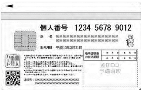
個人番号カードのイメージ (裏)