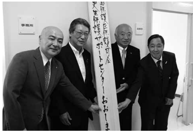
▶ 開所式にて(写真左から)新山大島保護区会長、椎木町長、柳居県議、渡辺山口保護観察所長