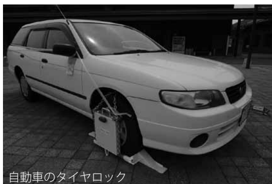
自動車のタイヤロック

●納税方法のご相談、納期限までの納付にお困り等、納税のご相談は税務課徴収対策班へご連絡ください。 税務課徴収対策班 ☎0820(74) 1031