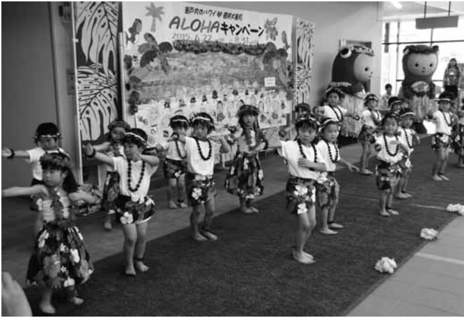
▲ 開幕セレモニーでフラダンスを披露する園児

6月22日、大島庁舎でアロハキャンペーン2015開幕セレモニーが開催されました。 式典では、久美保育所と蒲野保育所の園児21名が、「アロハ大島」と平成22年に姉妹島のカウアイ島から周防大島町にプレゼントされたフラミュージック「カイマナくん」の2曲を音楽に合わせてフラを披露しました。 キャンペーンは8月31日まで実施され、期間中は、役場、漁協、商工会、郵便局、銀行、各福祉施設、ホテル等の職員が、アロハシャツでもてなします。