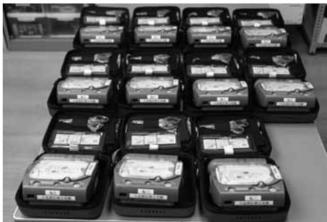
▲大島郡医師会から寄贈されたAED

日頃の練習時にはもちろん、対外試合の際にも常に携帯して、緊急時に迅速な救命活動ができる環境が整いました。