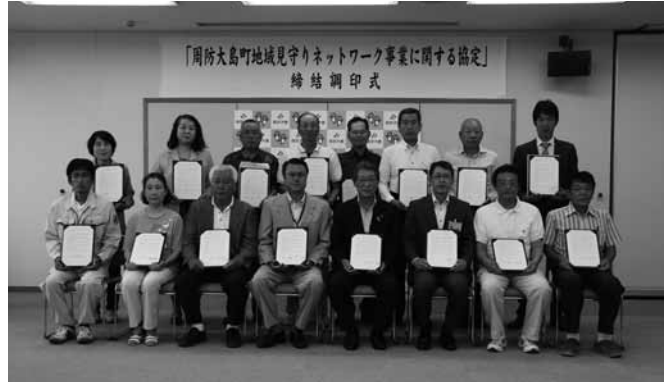
▶ 調印式に出席した皆さん

協定には事業者64社、個人20人が参加し、日常業務中の範囲内でさりげない見守りを行い、倒れているなどの緊急性を要するものから、郵便受けに物が何日も溜まっていたり、何回か訪