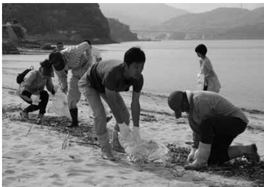
▲鳥くらす海そうじ (撮影：西山 喬)

今回、御縁をいただき、「ふるさと海」というコーナーをお手伝いしました。星野先生のエッセイ「霊薬の海」をモチーフに、地域おこし