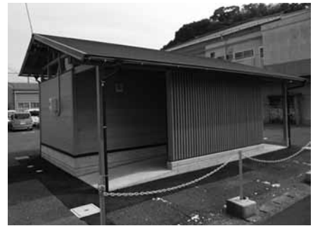
▲安下庄に完成した公衆トイレ (26年度)