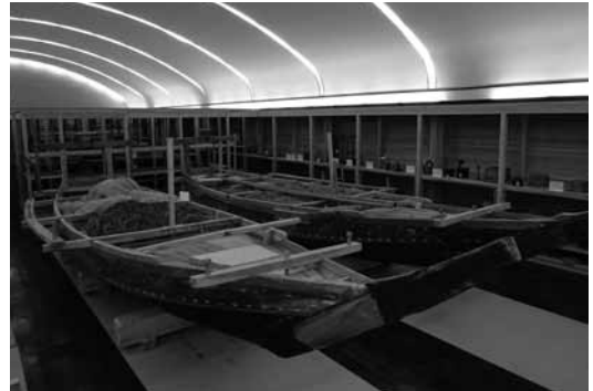
周防大島東部の生産用具

「周防大島東部の生産用具」3456点は、白木公有地の東和収蔵庫に保存されている。これらの民具は東和町史を編纂中の故宮本常一先生が、町内の生活環境の変化により有形・無形の民俗文化財が急速に失われていると、町に対してその収集保存の必要性を提唱された。提言を受けた町は宮本先生に民具の調査収集保存の指導を依頼し、その指導下で青年団や町内の有志が土日を利用して約1万点の民具を収集した。