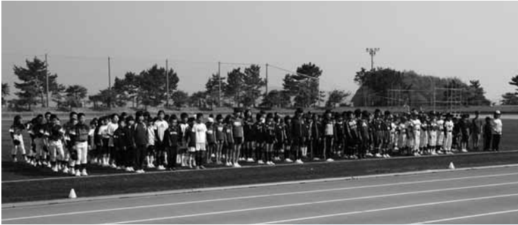
町内の団員が勢ぞろい