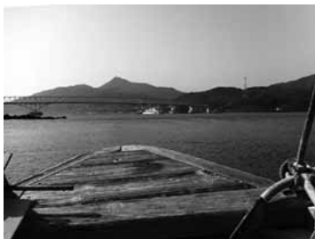
▲春の大潮、ワカメ採りの船から眺める大島大橋

したが、周防大島町定住促進協議会が年3回行なっている移住希望者向けの町内案内ツアー「島時々半島ツアー」が5月16日〜17日で開催されます。どんな理想を持って島を訪れるかは人それぞれですが、移住希望のみなさんと島の暮らしについてお話してみませんか？