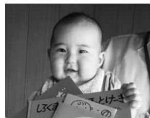
▲読み聞かせサポート事業