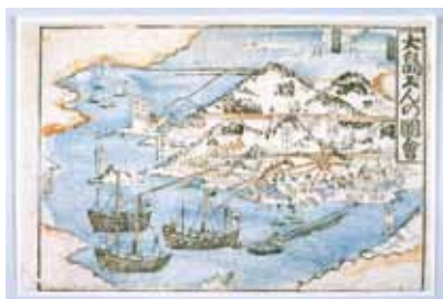
四境戦争図「大島ぐんの図会」 (山口県立山口博物館所蔵)