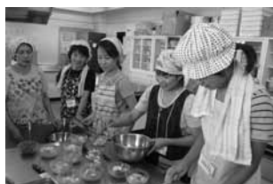
おはぎの会の様子