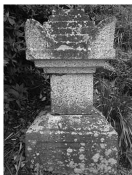
建武二年宝篋印塔

この宝篋印塔(本来は経文を納めたが後には供養塔、墓碑)は、現位置に半ば埋もれて、散乱した状態で見つかった。