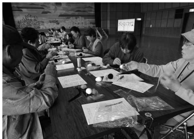
昨年度の生涯学習講座の様子

大島公民館 ☎ 74 - 3800 F A X 74 - 3999 oshimakuyoi@town.suo-oshima.lg.jp