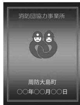
表示証のイメージ

この「表示証」を見やすい場所に表示していただくことにより地域の皆さんに、社会貢献事業所であることをお知らせできます。