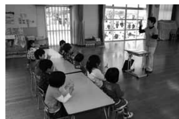
▲保育所英語講師派遣事業