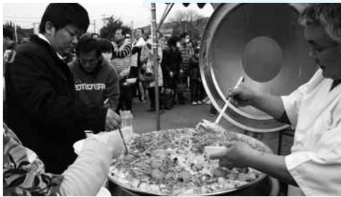
▲恒例のみかん鍋の振る舞いでは、長い行列ができました。

またイベントの最後には恒例となっている、みかん鍋の振舞いも行われ、今年は寒い時季での開催ということで、集まった人々はあつあつの鍋をほお張り、心も体も温まりました。