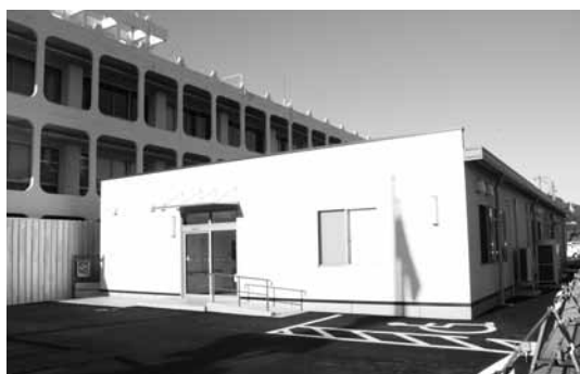
▲新しく建設された橘庁舎 （橘総合支所が業務）