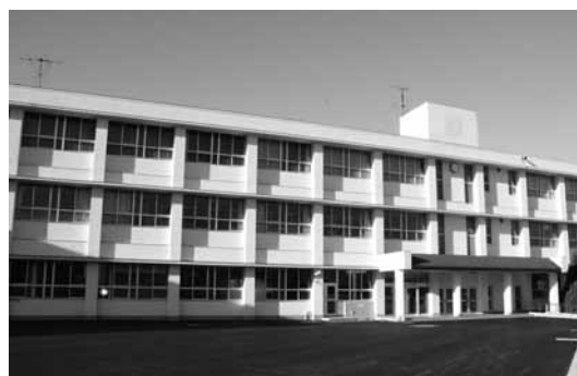
▲旧日良居中学校が改修された日良居庁舎 （健康増進課・介護保険課が業務）

※健康福祉部の福祉課（民生福祉班・生活支援班）はこれまで通り、たちばなケアプラザで業務を行いますので、住所・電話番号等の変更はありません。