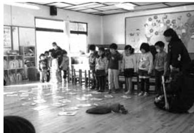
食育カルタで、豚汁の食材を探しました。

蒲野保育所では、野菜を育てて収穫し旬の味覚を楽しむ体験や命をいただく学びの時間が設けられ、五感と感謝の心を育む食育が行われています。毎日口にする食べ物で身体はつくられます。食べることは、生きるための基本的な営みだからこそ、「意識して食べる」よう心がけたいですね。