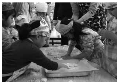
食育カルタの後はお団子を作って、豚汁をつくりました。