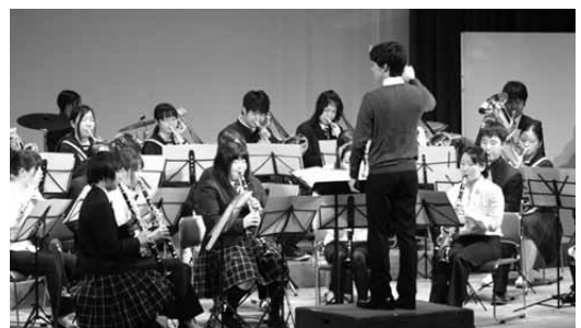
▲昨年の定期演奏会