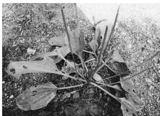
情島のトウオオバコ

はじめに名前をつけた学者が至る所に見られる普通のオオバコと異なるので、唐(中国)から渡ってきたものであると思っ て、トウオオバコと名づけた。実際は日本に自生していた。次 の特徴がある。葉は黄緑色で柔らかく、ナメクジほか虫によく 食害される。果実内の種子が9〜13個で多く、種子の長さは1 ミリである。霜がごく少ないか、ない所に生える。山口県では 情島だけに生育する。本州では他に広島県の福山市走島や呉市 倉橋町鹿島に記録される。九州にも記録されるが、私は見てい ない。情島では昭和時代までは至る所に密生していたが、その 後、除草剤散布により、小中学校の近くを除いてほとんど全滅 した。平成14年7月1日に大畑地区が町の天然記念物に指定さ れた。平成14年3月に県の絶滅危惧種1Aとして「レッドデー タブックやまぐち」に記録された。県内外から見に来る人も多 いので皆で保護したいものである。