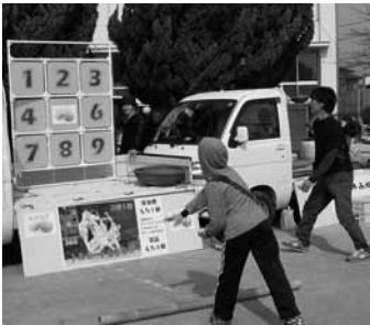
▲2月15日 周防大島まるかじり・ストラックアウトの様子

2月15日は周防大島まるかじり。メインイベントとなった1万個の餅まきには毎回約千五百人が集まり、大変な盛り上がりを見せました。日本一餅が行き交う島といわれる周防大島の名物になりそうです。毎年恒例の軽トラ市場にも30台を超える出店があり、こちらも大盛況。私は、ボールでの抜くストラックアウトを提供しました。拾ったお餅でストラックアウトに参加できる気軽さもあり、会場の子どもたちが大集合。少子高齢の島にあって、多くの子ども