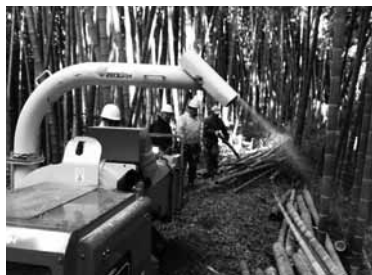
▲三浦での里山保全活動の様子

くりのん太の会、ふるさと里山救援隊、美しい三浦を創る会の共催による第6回竹きり大会が3月7日(土)午前9時より、こちら西三浦の国道沿いで開催されます。里山に親しみながら竹の伐り方、処理方を学ぶ会です。奮ってご参加ください（詳しくは13ページ催しのコーナーを参照ください）。 そして、毎月恒例の海岸清掃「島くらす海そうじ」次回は、2月28日(土)午前11時より神浦の海岸を清掃します（雨天中止です）。美しい里海、里山づくりにご協力よろしく願います。