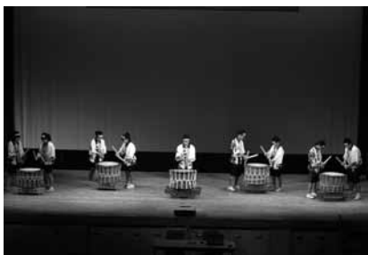
▲郷土おおしま発表大会

各校代表者の工夫を凝らした発表に、観衆も真剣に聞き入っていました。各校がお互いの発表を見聞きすることにより「郷土おおしま」について、知識と理解を深めるよい大会となりました。