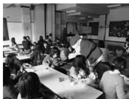
▲昨年12月18日に開催された親子交流会(クリスマス会)の様子

主な活動内容は、母子保健事業への協力、むし歯ゼロっ子表彰、マタニティーマークの普及啓発、各支部が開催する親子交流会などです。また、活動に必要な知識の向上のために研修会の参加や情報交換を行っています。