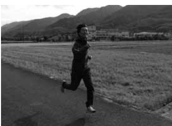
▲ロードレースに向けてトレーニング中です

さて、私ごとではございますが、昨年は観覧にとどまらず、10キロに出走することになりました。日々トレーニング中ですが、応援よろしくお願ひします。 そして、こちらも応援をお願いしたい月一回の海岸清掃「島くらし海そうじ」次回は、1月31日(土)午後2時より下田の海岸を清掃します。青い屋根に魚が目印の島津鮮魚店前の海岸に集合解散となります。周防大島の美しい海の景色をより美しく!ご協力のほどよろしくお願ひします。(雨天中止です)