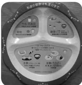
▲教室で使用した バランスプレート