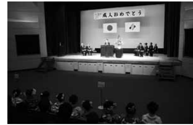
▲昨年度の成人式の様子