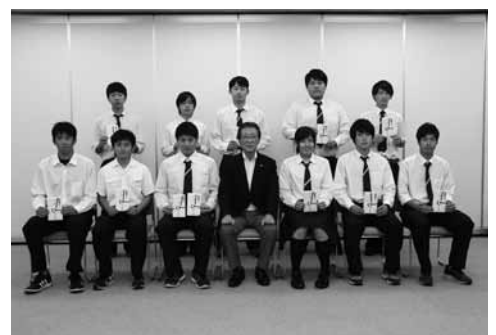
▲全国高等専門学校体育大会に出場された大島商船高専のみなさん(授与式:10月3日)